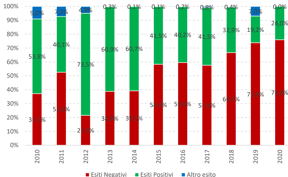
Figura 2 – Distribuzione % degli esiti amministrativi delle domande di protezione internazionale | Anni 2010-2020

Fonte: nostra elaborazione su dati del Ministero dell'interno.